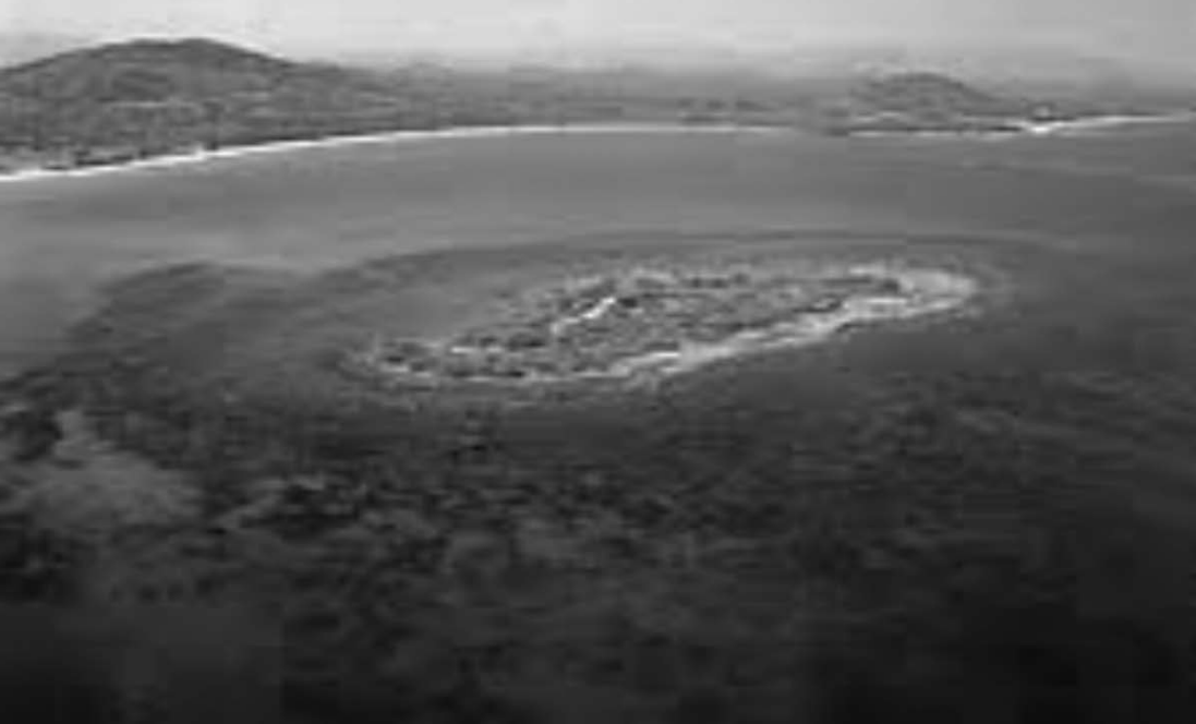
แนวปะการังหินกรูดที่ถูกหมกเม็ดว่าเป็นหินโสโครก

จนในที่สุดเมื่อความลับเปิดเผยว่ามีแนวปะการังบนพื้นที่กลางทะเล กระบวนการเชื่อมโยงที่เห็นคือหลังเกิดวิกฤติศรัทธาเรื่องการศึกษา EIA เป็นเท็จในพื้นที่บ้านกรูด-บ่อนอก ทั้งการจงใจบิดเบือนข้อเท็จจริงที่ นักวิชาการเข้าใจว่าคนในชุมชนไม่ได้มีความรู้ทางวิชาการที่จะมาได้แย้ง ข้อมูลทางวิชาการได้แต่อย่างใด การรับข้อมูลด้านเดียวของหน่วยงานรัฐเองก็ดี ทำให้มองไม่เห็นข้อเท็จจริงของชุมชน ไม่เห็นข้อเท็จจริงของการใช้ชีวิตที่สำคัญไม่ตอบสนองสิ่งที่รัฐเองพยายามท่องว่าการจะทำโครงการใดๆ ที่จะส่งผลกระทบต่อตามที่กฎหมายได้บัญญัติต้องรับฟังความเห็นประชาชน หรือแม้แต่ต้องให้มีส่วนร่วม ในที่นี้มีความเข้าใจที่แตกต่างกันอย่างสิ้นเชิง ระหว่างภาคประชาชนที่อยู่ในพื้นที่การพัฒนาฝ่ายหนึ่ง กับเอกชนและรัฐบาลอีกฝ่ายหนึ่ง การที่ยังไม่สามารถทำให้ตกลงทางความคิดในการพัฒนาโครงการขนาดใหญ่ในพื้นที่ที่มีความขัดแย้ง การจับเท็จในรายงานการวิเคราะห์ผลกระทบสิ่งแวดล้อมที่บริษัทที่ปรึกษาในฐานะลูกจ้างของ