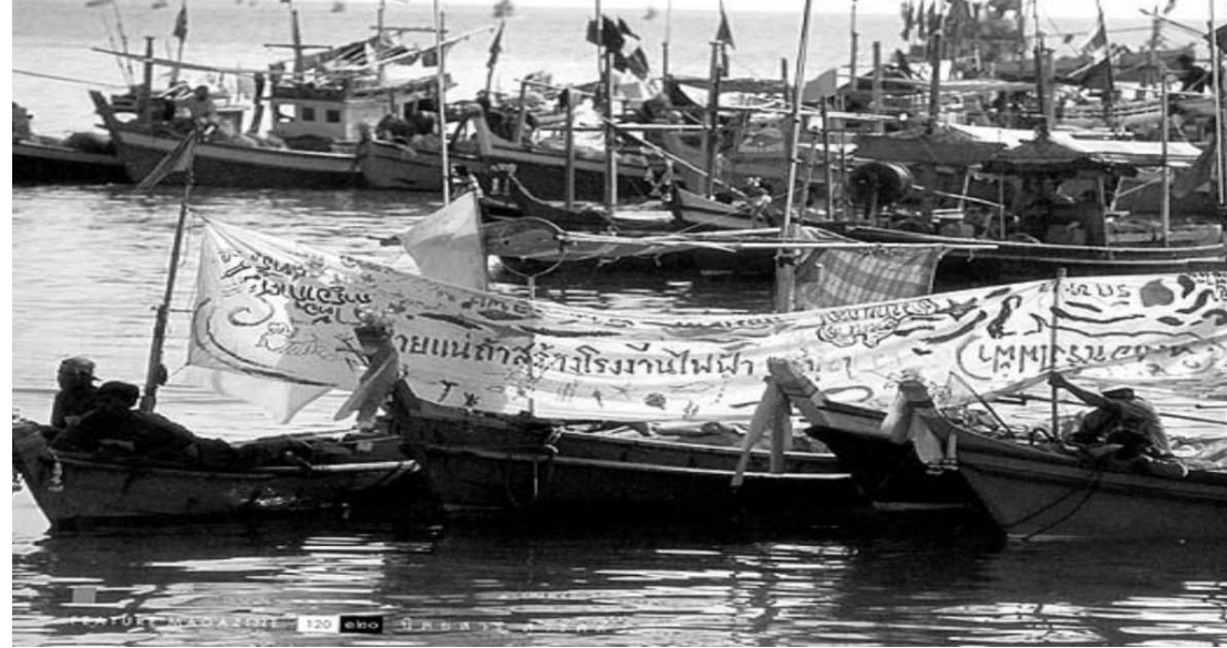
ภาพชาวประมงรวมตัวคัดค้าน

นอกจากนี้ ยังมีกรณีโต้แย้งของพี่น้องชาวประมงฯ ในเรื่องการลงนามอนุมัติสัญญาสัมปทานระหว่างรัฐและเอกชนที่ลงทุนร่วมกัน แต่หลีกเลี่ยงการเข้าสู่กระบวนการที่ต้องตรวจสอบเต็มรูปแบบโดยคณะกรรมการสิ่งแวดล้อมแห่งชาติ โดยมีข้ออ้างว่าเอกชนลงทุนเอง แต่ในข้อเท็จจริงเป็นการลงนามสัญญาร่วมกัน ทำให้เห็นเจตนาของการลงทุนที่แสวงหาผลประโยชน์ของทรัพยากรส่วนรวม ตั้งแต่ใช้แนวชายหาดมาสร้างท่าเรือ ใช้พื้นที่ทางทะเลมาสร้างสะพานท่าเทียบเรือ ใช้พื้นที่ดอนหอยมากองดิน ทRAY และเลนที่ไหลมาจากการขุดลอกท่าเรือ วิถีของพี่น้องชาวประมงมิใช่เป็นเรื่องของคนใช้แรงงาน แต่เป็นเรื่องขององค์ความรู้และประสบการณ์ที่ไม่ได้มีสอนในโรงเรียน แม้แต่นักวิชาการที่ชอบใช้แบบจำลองชีวิตคนไว้ในกรอบแก้วที่เรียกว่างานวิจัย หลายเวทีที่พี่น้องชาวประมงได้ขึ้นโต๊ะเจรจากับคนระดับรัฐมนตรี และระดับนายกรัฐมนตรี ถึงปัญหาการจัดการทรัพยากรธรรมชาติที่ไม่เป็นธรรม เมื่อการเจรจาเริ่มขึ้น ชาวประมงตั้งคำถามกับรัฐมนตรีและนายกรัฐมนตรีถึงเรื่องราวความเป็นมาที่ตอกย้ำให้เห็นสภาพของการทำกินด้วยวิถีดั้งเดิมที่สร้างความมั่นคงให้กับครอบครัว หรือว่ารัฐจะทำลายล้างสังคมและความสงบสุขของชาวบ้านด้วยคำถามที่รัฐมนตรีและนายกรัฐมนตรีเองถึงกับอึ้งว่า “ทะเลไม่เคยปฏิเสธว่าคนที่ออกทะเล ต้องอายุไม่เกินหกสิบ และทะเลไม่เคยปฏิเสธเพศและวัย”