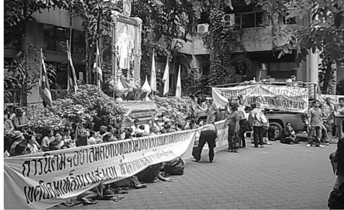
การใช้สิทธิตามรัฐธรรมนูญ

การนำรัฐธรรมนูญมาใช้รับรองสิทธิ ต้องยอมรับว่าในประเทศไทย ปัญหาความขัดแย้งที่มีให้เห็นมากที่สุด คือความขัดแย้งที่มาจากโครงการพัฒนาของรัฐ เพราะการพัฒนาอุตสาหกรรมของประเทศ เป็นเรื่องความเชื่อของคนไม่กี่คนที่คิดว่าประเทศต้องเดินอย่างไร โดยมีกฎหมายรองรับการพัฒนาถูกกำหนดโดยกลุ่มคนแค่กลุ่มเดียวที่ได้รับการยอมรับจากฝ่ายรัฐที่มีความเชื่ออย่างฝังหัวว่าคนที่ผ่านการเรียนรู้อะดับสูงเท่านั้นจะสามารถทำให้ประเทศไทยทันสมัยเทียบเท่ากับอารยประเทศได้ จึงเป็นกรรมของชาวบ้านที่ต้องทนรับสภาพการพัฒนาที่มีกรอบและแนวทางเพื่อสนองตอบแต่เฉพาะกลุ่มทุนเท่านั้น พี่น้องชาวประจวบคีรีขันธ์ใช้ทุกช่องทางที่จะต่อสู้คัดค้านโครงการการพัฒนา ถ้าไม่ล้มล้มในข้อเท็จจริงในพื้นที่ จะเห็นถึงวิธีการที่ค่อนข้างแปลกเมื่อกลับไปมองกลุ่มพี่น้องอื่นๆ เพราะฝ่ายรัฐมักมองการเคลื่อนไหวคัดค้านของประชาชนแบบจับผิด ไม่ใช่การมองเพื่อ