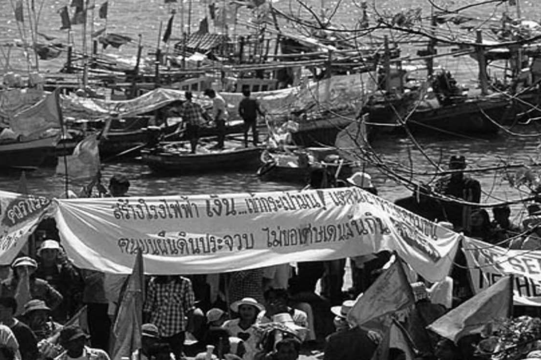
ภาพการเติบโตของภาคประชาชน

คำถามเกิดขึ้นมากมายว่าเวลานี้รัฐได้ให้สิทธิประชาชนที่เป็นสิทธิขั้นพื้นฐานในทางการเมืองมากน้อยแค่ไหน หรือที่ประจวบคีรีขันธ์ที่เดียวที่ประชาชนตื่นตัวสูงทางการเมือง แต่หากปัญหาความขัดแย้งที่เกิดจากการแย่งชิงทรัพยากรเกิดขึ้นทั่วไปในทั่วทุกภาค และทุกมุมของประเทศไทย ดังที่ข้าพเจ้าได้เดินทางไกลมาตลอด ๑๖ ปี ข้าพเจ้าได้พบว่าสิ่งที่นักการเมือง และคนในภาครัฐได้กระทำกับคนทุกชั้นคนยากที่อยู่ภายในการปกครองดูแลตามหน้าที่ที่พวกเขาเข้าใจ ตามความเห็นและเข้าใจในความเป็นเจ้าคนนายคนตามที่ข้าราชการได้ถูกปลูกฝังแนวคิดแบบรวบอำนาจ ข้าราชการทั่วไปมักคิดในแง่ที่ถือตนว่ามีอำนาจ แต่ไม่ได้คิดในอีกแง่มุมหนึ่งที่ข้าราชการเป็นบุคคลที่ถูกเลือกให้เป็นผู้บำบัดทุกข์บำรุงสุขของประชาชนตามหน้าที่ แต่ตามค่านิยมของประเทศไทย คนยากคนจน