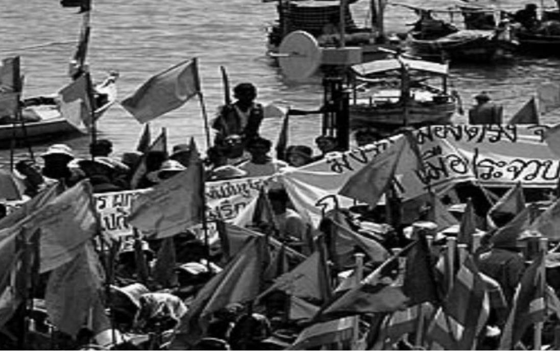
ภาพคัดค้านประชาธิปไตยโรงไฟฟ้าประจวบ

ต่อเนื่อง แกนนำชาวบ้านทั้งที่บ้านกรูดและบ่อนอกถูกลอบทำร้ายรายวัน นำไปสู่ข้อตกลงกับรัฐบาล ในเดือนธันวาคม ๒๕๔๑ ชาวบ้านประจวบฯ เข้ากรุงเทพฯ เพียงหวังให้รัฐบาลทบทวนการยกเลิกโครงการโรงไฟฟ้าที่จังหวัดประจวบคีรีขันธ์ ในครั้งนั้นได้ข้อสรุปที่ทำให้ต้องรอคำตอบจากฝ่ายรัฐบาลในวันที่ ๙ ธันวาคม ๒๕๔๑ ที่ศาลากลางจังหวัดประจวบคีรีขันธ์ จนเกิดการสลายการชุมนุมกันอย่างรุนแรง จนเป็นเหตุให้ชาวประจวบฯ ถูกตั้งคำถาม และถูกเรียกร้องให้ต้องรับผิดชอบในสิ่งที่เกิดขึ้น จนถึงทุกวันนี้ยังฝังอยู่ในความรู้สึกของชาวบ้านเป็นบาดแผลลึกในใจและในสังคม จากสาเหตุที่รัฐบาลอาศัยช่วงที่ชาวบ้านยังไม่เท่าทันโดยการหลอกให้รอคำตอบจากรัฐบาลเพื่อหาทางแก้ไขปัญหาโรงไฟฟ้าที่ประจวบคีรีขันธ์ แต่ในที่สุดการแก้ไขปัญหาก็ไม่เกิดขึ้น มีหน้าซ้ำยังมีการเตรียมกำลังไว้เพื่อสลายการชุมนุม หลังจากนั้นรัฐบาลเปิดให้มีการทำประชาพิจารณ์เพื่อลดความขัดแย้งทันที หรือแม้แต่การยกขบวนพี่น้องประชาชนไปให้ความเห็น