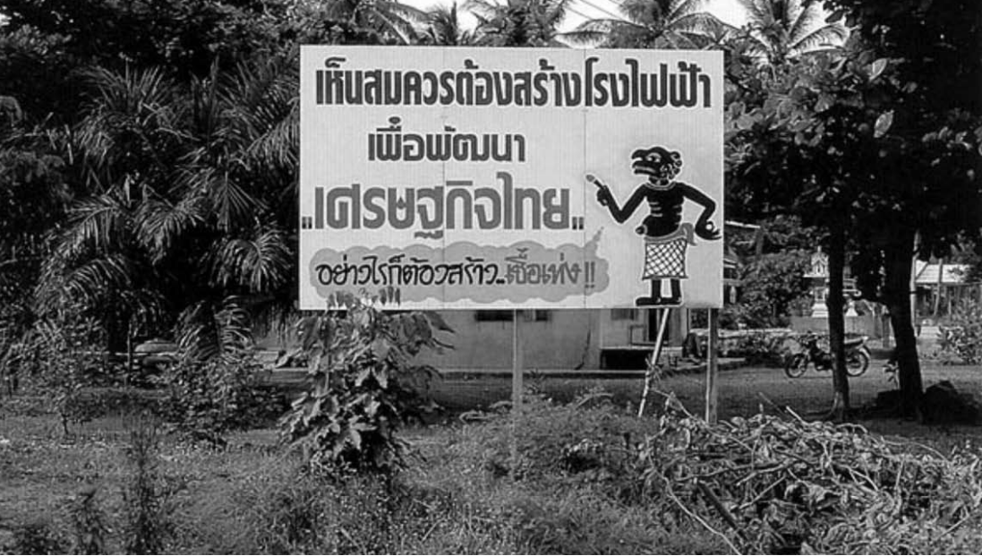
เห็นควรสร้าง นำมาสู่ความขัดแย้งในหมู่บ้าน