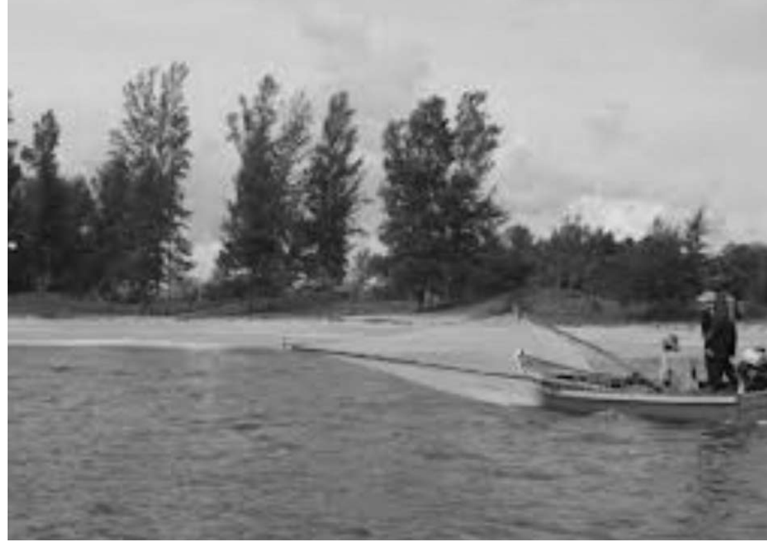
ชายทะเลประจวบคีรีขันธ์

ท่องเที่ยว กลุ่มนายหน้าก็จะบอกว่ารวมที่ดินเพื่อพัฒนาการท่องเที่ยว เป็นต้น เพราะถ้าทุกฝ่ายให้ความสำคัญในการรับรู้ความจริงร่วมกันทุกฝ่ายก็จะลดปัญหาความขัดแย้งในพื้นที่ในช่วงต่อไปได้