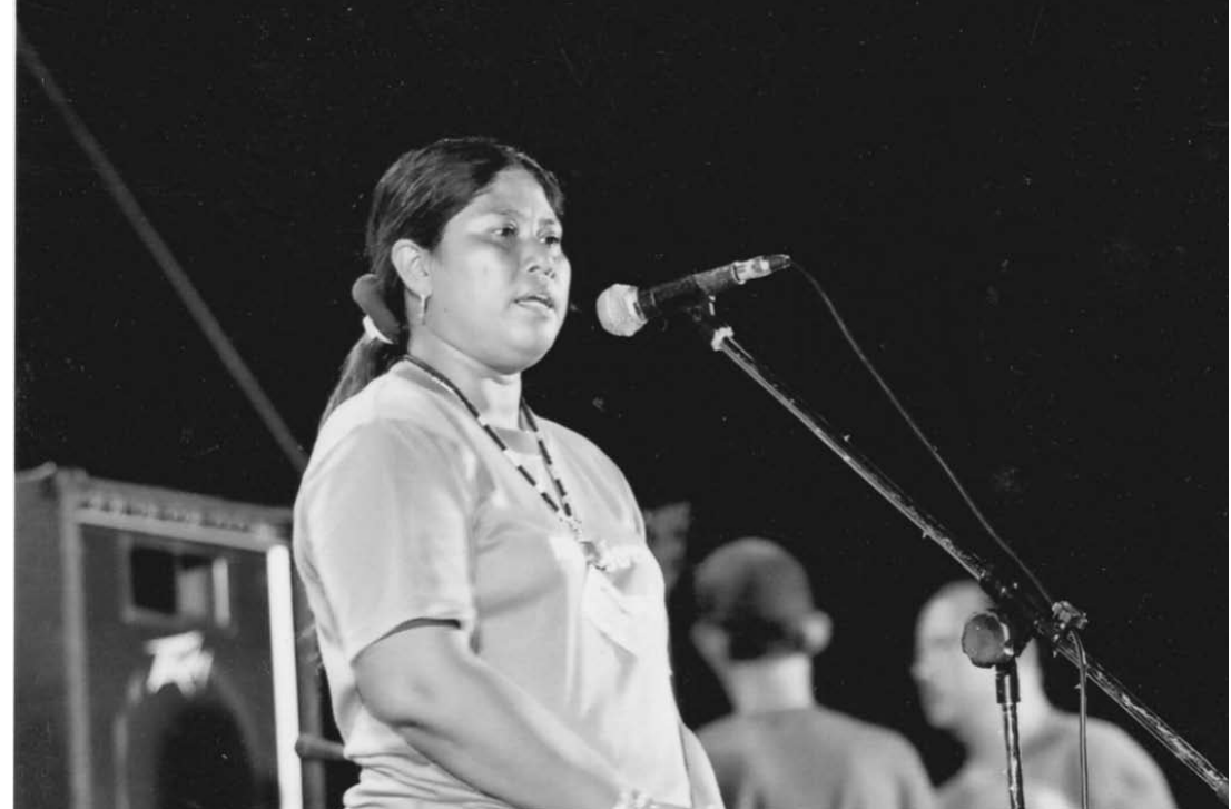
การเคลื่อนไหวในสมัยต่อต้านโรงไฟฟ้า

จากสาเหตุความขัดแย้งในการแย่งชิงทรัพยากรระหว่างคนจนและคนรวยที่ยังมีช่องว่างมหาศาล สิ่งที่ต้องขบคิดกันอย่างลึกซึ้งคือการใช้ทรัพยากรที่กลุ่มทุนใช้เป็นการทำลายของเก่าที่ชาวบ้านใช้ประโยชน์อยู่เดิม เช่น กรณีการทำท่าเรือสำหรับขนถ่ายถ่านหิน กลุ่มทุนมักอ้างว่าผลการศึกษาบริเวณที่ต้องสร้างท่าเรือมีน้ำลึกได้ระดับที่สามารถสร้างท่าเรือได้ โดยลดภาระค่าใช้จ่ายของงานก่อสร้าง ขณะเดียวกันร่องน้ำลึกก็เป็นพื้นที่ที่เหมาะสมสำหรับเป็นที่เพาะพันธุ์ปลา และเป็นที่เหมาะสมสำหรับแม่พันธุ์