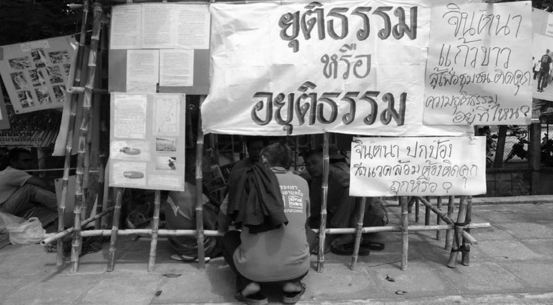
ชาวบ้านสร้างกรงขังจำลองความยุติธรรม

การยื่นอุทธรณ์จากผู้ที่เกี่ยวข้องด้วยความอคติเพราะหลังจากการพิพากษาคดีข้าพเจ้าแล้วเสร็จ รุ่งขึ้นสื่อมวลชนได้นำเสนอข่าวออกไปในทางให้กำลังใจต่อข้าพเจ้าในการต่อสู้ที่สามารถพิสูจน์ต่อศาลได้ว่าข้าพเจ้าไม่มีความผิด