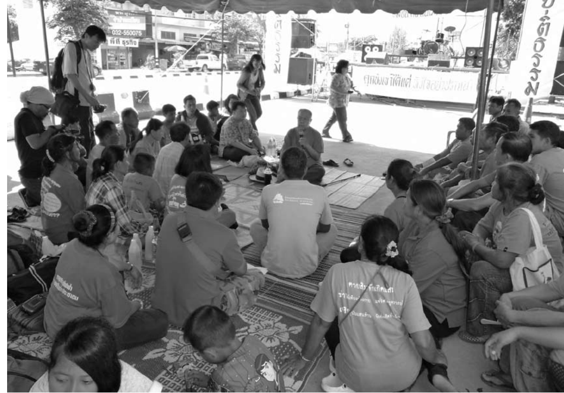
การเยี่ยมของ ส.ศิริวัชร

จากวันนั้นถึงวันนี้ ทุกท่านคงมีคำตอบว่าทำไมข้าพเจ้าจึงต้องคำพิ พากษาให้จำคุก ๔ เดือนโดยไม่รอลงอาญา ในขณะที่ “ไ้ปัด” ฆ่าคนตาย ไม่ต้องติดคุกและนักวิชาการที่รับสารภาพว่าฆ่าเมียตายด้วยการตีเมียตัว เองด้วยไม้กอล์ฟจนตายคามือก็ยังสามารถรอลงโทษได้ ส่วนคดีของ ข้าพเจ้าซึ่งเป็นคดีที่เล็กน่อยมากเมื่อเทียบกับคดี “ฆ่า” ที่มีเรื่องความเป็น ความตายเข้ามาเกี่ยวข้อง ทั้งที่กฎหมายอาญาในมาตราที่ ๕๖ ประมวล กฎหมายอาญาเกี่ยวกับการรอลงโทษเองก็ระบุไว้ชัดเจนว่าสามารถ ทำได้