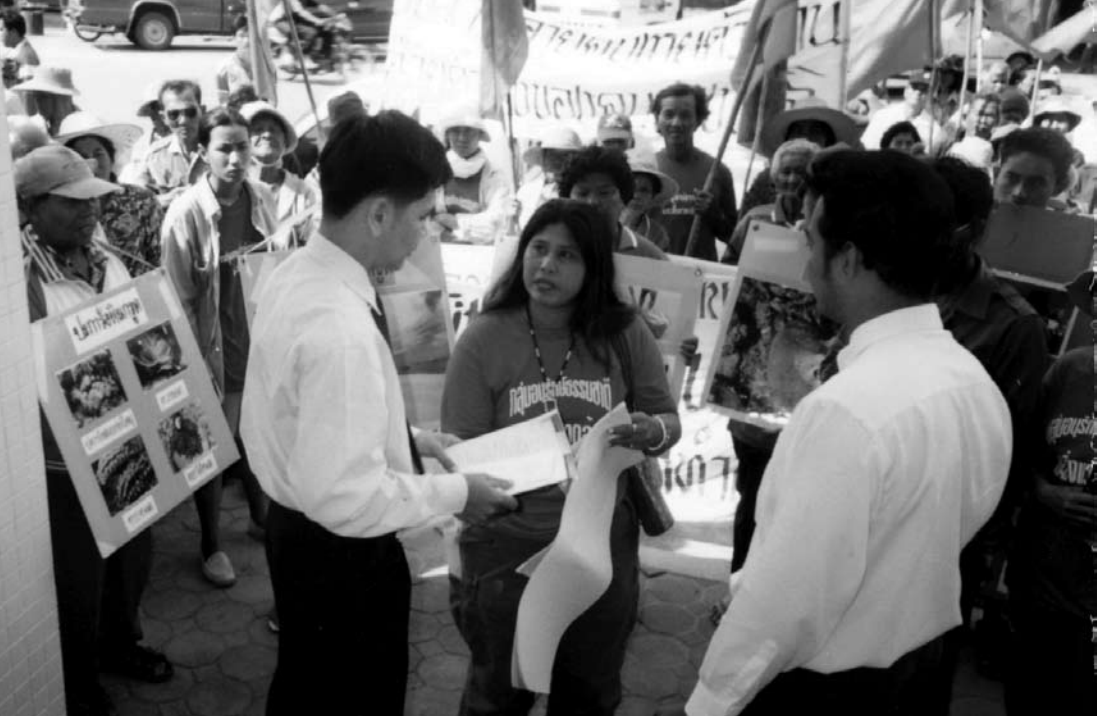
ตัวอย่างการเคลื่อนไหวของกระบวนการภาคประชาชนด้านสิ่งแวดล้อม

ปีพ.ศ. ๒๕๓๗ ไม่ใช่เรื่องง่ายที่ใครจะชนะการประมูลโครงการ Independent Power Producer (IPP) และได้เซ็นสัญญาขายไฟฟ้าให้แก่การไฟฟ้าฝ่ายผลิต (กฟผ.) เป็นเวลานานถึง ๒๕ ปี แต่บริษัท กัลฟ์เพาเวอร์ เชนเนอร์เรชั่น และบริษัท ยูเนี่ยน เพาเวอร์ ดีเวลลอปเม้นท์ จำกัด ก็เป็นสองในเจ็ดบริษัทผู้ผลิตไฟฟ้าอิสระทำสำเร็จมาแล้ว โดยการไฟฟ้าฝ่ายผลิตแห่งประเทศไทย (กฟผ.) เซ็นสัญญาซื้อไฟฟ้ากับ IPP ทั้งเจ็ดรายเสร็จสิ้นไปตั้งแต่เดือนธันวาคม ๒๕๔๐ ถึงแม้ว่าที่ตั้งโรงไฟฟ้าของทั้งสองบริษัทจะไม่ใช้พื้นที่ในสวนใจกลางกรุงเทพฯ ตามที่ถูกระบุโดย กฟผ. และสำนักงานคณะกรรมการนโยบายพลังงานแห่งชาติ (สพช.) จะบอกว่าเหมาะสมจะสร้างโรงไฟฟ้ามากที่สุดในขณะนั้น แต่มันก็อยู่ในพื้นที่ที่ถูกดึงเอาไว้เป็นอันดับที่รองลงมา นั่นคือพื้นที่ติดชายทะเลคือแนว “ชายฝั่งทะเลตะวันตก ตั้งแต่ประจวบคีรีขันธ์ ขึ้นมาจนถึงสมุทรสาคร” ซึ่ง กฟผ. คาดว่า