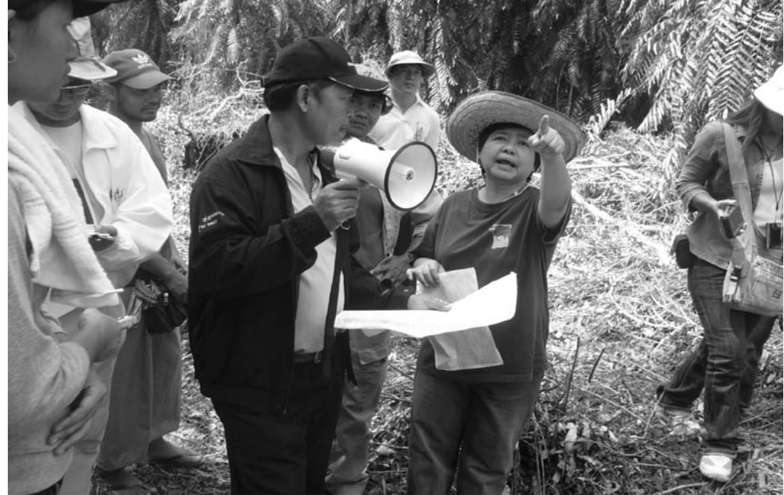
การตรวจสอบป่า

สมัยก่อนการทำงานและการประสานงานในช่วงแรกระหว่างชาวบ้านและองค์กรอิสระ เอ็นจีโอ เป็นเรื่องง่าย ไม่เหมือนสมัยนี้ซึ่งไม่ทราบใครเป็นใคร การประสานงานเพื่อต้องการให้มาร่วมรับรู้และตรวจสอบปัญหาที่มองแล้วนี่ก็คือเรื่องที่ซับซ้อน ลำพังเราไม่มีอำนาจในการเดินไปบอกแก่ผู้ว่าราชการจังหวัดได้แน่นอน ว่าเราเห็นความพิกลพิการของรูปลักษณะการจัดการพื้นที่ที่มีนายทุนกุมสภาพอยู่แล้ว การรื้อแจ้งหน่วยงานรัฐตั้งแต่ผู้ว่าราชการจังหวัด หรือนายอำเภอที่ดูแลพื้นที่ รวมถึงผู้ที่มีส่วนเกี่ยวข้องในการตรวจสอบแนวเขตป่าสงวนแห่งชาติ และแนวเขตที่ดินแน่นอนว่าหน้าที่อย่างนี้ไม่ใช่หน้าที่ชาวบ้านที่จะมีเครื่องมือหรืออุปกรณ์มาตรวจสอบได้ แต่เราต้องไม่ลืมว่าแม้ไม่มีเครื่องมือแต่ในฐานะที่เป็น