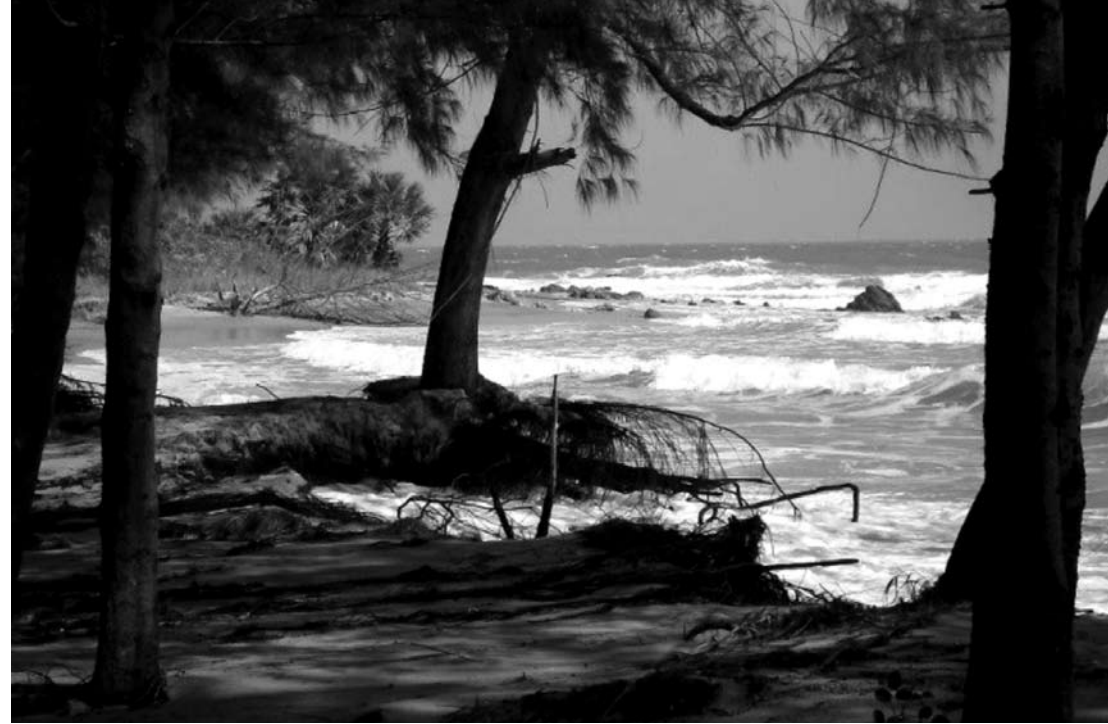
ที่ดินสาธารณะที่นำไปรวมกับที่ดินเอกชนเพื่อสร้างโรงไฟฟ้า

เพื่อคัดค้านโรงไฟฟ้าถ่านหินในพื้นที่เกิดขึ้นตามที่ทุกคนสำนึกตามสัญชาตญาณของชาวบ้าน เมื่อรับรู้เรื่องการก่อสร้างโรงไฟฟ้าถ่านหินอยู่ใกล้ๆ บ้าน ณ เวลาที่พี่น้องประชาชนได้รับรู้เรื่องการก่อสร้างโครงการโรงไฟฟ้าถ่านหินในพื้นที่บ้านกรูด และในพื้นที่จังหวัดประจวบคีรีขันธ์