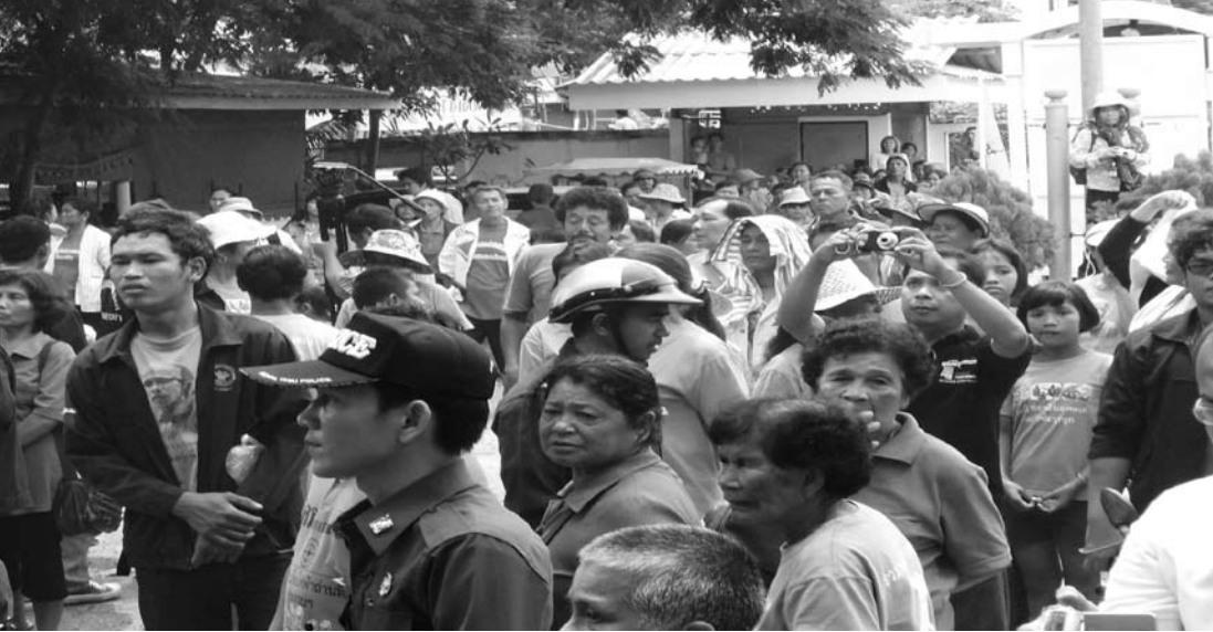
ภาพการเคลื่อนไหวกองเมืองภาคประชาชน

การปฏิบัติหน้าที่ของเจ้าหน้าที่รัฐ แม้ว่าประเทศไทยเราจะมี การบังคับใช้รัฐธรรมนูญมาแล้วหลายปีก็ตาม ก็ไม่ได้ทำให้กลุ่มผู้มีอำนาจรับ รู้และปฏิบัติตามกรอบของกฎหมาย ชาวบ้านส่วนใหญ่อาจไม่เท่าทันต่อ เจ้าหน้าที่ของรัฐที่รับหน้าที่โดยตรงในการสร้างกระบวนการรองรับในรูป แบบที่ต่างกัน ข้าพเจ้ามองเห็นหลายปัญหาที่เกิดจากการก่อสร้าง โครงการขนาดใหญ่ ที่มักมีปัญหาคความขัดแย้งเกิดขึ้นมากที่สุด และด้วยความไม่รู้ ถือดี ไม่เท่าทัน ของกลุ่มผู้นำท้องถิ่นเหล่านี้จึงกลายเป็นปัญหา ใหญ่ของการพูดคุยในระดับประชาธิปไตยเป็นอย่างมาก สาเหตุคือการ ที่ผู้นำท้องถิ่นสำคัญผิดว่าการที่เข้ามามีตำแหน่งทางการเมืองเป็นตัวแทน ในการตัดสินใจ และมีอำนาจในการอนุมัติเห็นชอบมติ หรืออนุญาตการ ก่อสร้างเป็นหน้าที่ของพวกเขาที่จะต้องตัดสินใจแทนประชาชน และเมื่อ วันหนึ่งเกิดการคัดค้านของพี่น้องประชาชน การพูดคุยเพื่อหาข้อยุติ การเจรจาตกลงแก้ไขปัญหาในพื้นที่จึงไม่สามารถเกิดขึ้นได้ เมื่อมีการก้าว เข้ามาในชุมชนของโครงการขนาดใหญ่