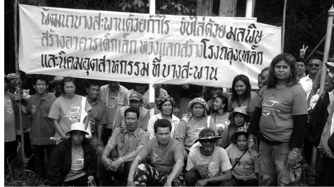
ความขัดแย้งในสถานศึกษา

ความขัดแย้งอีกอย่างหนึ่งที่เกี่ยวข้องกับวัดและศาสนา คือ การที่สัปเหร่อ ซึ่งมีหน้าที่เผาศพประกาศทางสื่อมวลชนว่าจะไม่เผาผีให้กับชาวบ้านที่สนับสนุนการก่อสร้างโรงไฟฟ้าเด็ดขาด และไม่ให้เผาในวัดที่สัปเหร่อทำนนี้รับผิดชอบ ผู้สนับสนุนโรงไฟฟ้าก็ต้องไปหาวัดที่สนับสนุนการก่อสร้างโรงไฟฟ้าเพื่อให้มีการเผาศพญาติพี่น้องของตัวเอง ทำให้เป็นเรื่องที่น่าอดสู่นักในสังคมเมืองพุทธ การแยกวัดกันทำบุญ และการแยกวัดกันเผาศพมิให้เห็นจริงในพื้นที่ที่เกิดการพัฒนาโครงการขนาดใหญ่ ที่ข้าพเจ้าได้พบและพยายามบอกกล่าวอย่างไม่อายว่าข้าพเจ้าต้องการให้สังคมได้สื่อสารในประเด็นเหล่านี้ให้เป็นที่รับรู้ เพื่อรัฐบาลจะได้ทบทวนก่อนที่สังคมในแต่ละพื้นที่จะแตกแยกกันมากยิ่งขึ้น เพราะที่ใดเกิดความแตกแยกภายในสังคมจนลุกลามถึงในวัดย่อมชี้ให้เห็นถึงความเสื่อมทางสังคมนั้นได้ไม่ยาก