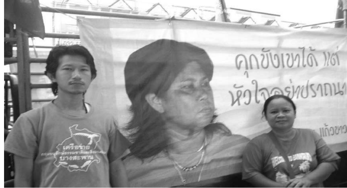
ภาพการยื่นหยัดสู้กับความอยุติธรรม

จำได้ว่าเมื่อข้าพเจ้าได้รับหมายเรียกจากศาลให้เตรียมพร้อมเพื่อฟังคำพิพากษา ข้าพเจ้าได้ประชุมพี่น้องในกลุ่มของข้าพเจ้าหลายครั้งเพื่อเตรียมงานที่จะต้องขับเคลื่อนต่อไปในยามที่ข้าพเจ้าไม่ได้อยู่บ้าน ข้าพเจ้าต้องเตรียมความรู้สึกของครอบครัว และเตรียมพี่น้องในกลุ่มของข้าพเจ้าทุกคนให้เข้มแข็ง ไม่ร้องไห้ในยามที่ศาลอ่านคำพิพากษาให้ข้าพเจ้าต้องเข้าสู่การควบคุมของกรมราชทัณฑ์ เพราะข้าพเจ้าเชื่อว่าในยามที่พี่น้องต้องฟื้นความรู้สึกในการที่ต้องแสดงความแกร่งเพื่อให้กลุ่มทุนได้เห็น คงเป็นเรื่องยาก และข้าพเจ้าก็เชื่อว่าการที่จะบอกแก่คนในครอบครัวของข้าพเจ้าให้ไม่รู้สึกใดๆ ในยามที่คนในบ้านต้องเดินเข้าคุกด้วยสาเหตุของการปกป้องชุมชนให้รอดพ้นจากมลพิษถ่านหินก็คงเป็นไปได้ยากเช่นกัน แต่ข้าพเจ้าก็คิดว่าพี่น้องต้องทำให้ได้ นี่คือน้ำที่อีกหน้าที่หนึ่งที่พี่น้องต้องเตรียมพร้อม นี่คือน้ำที่อีกรูปแบบหนึ่งของการต่อสู้กับทุนและรัฐอีกรูปแบบ